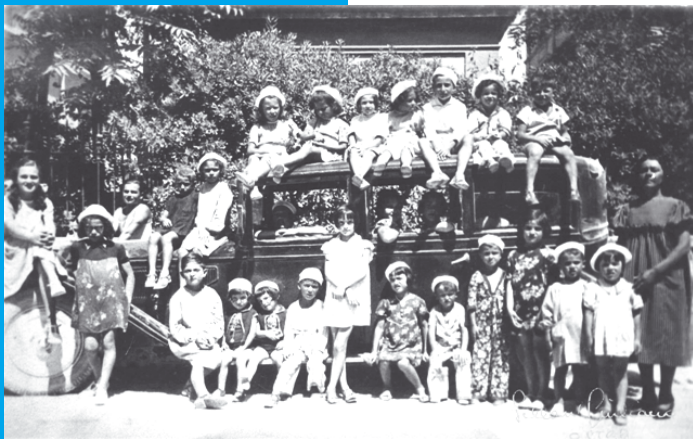
La colonia Marina