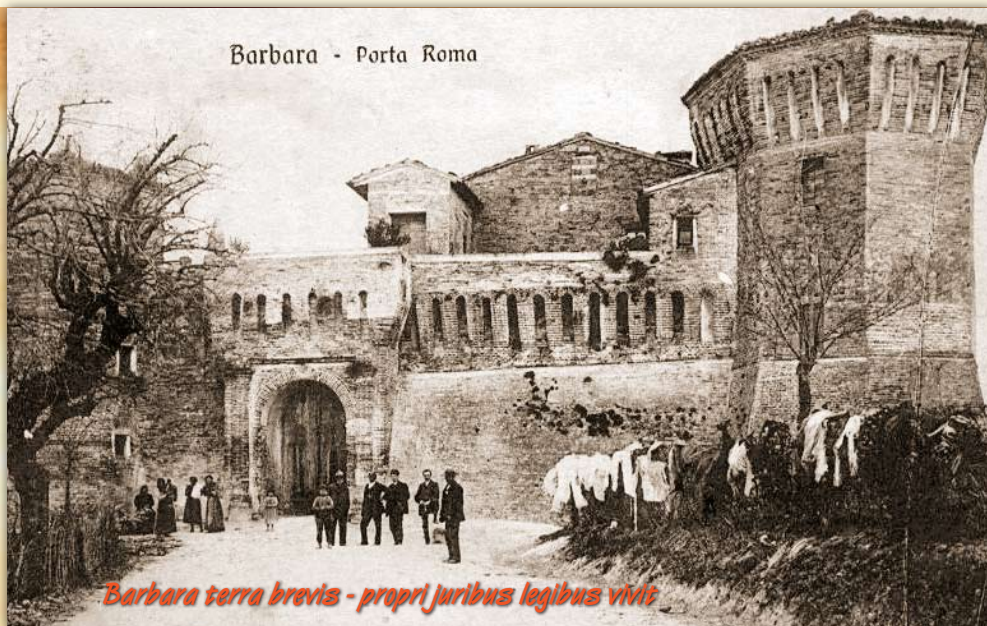
Barbara terra brevis - propri juribus legibus vivit